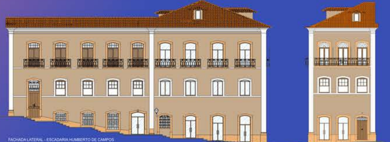
FACHADA LATERAL - ESCADARIA HUMBERTO DE CAMPOS