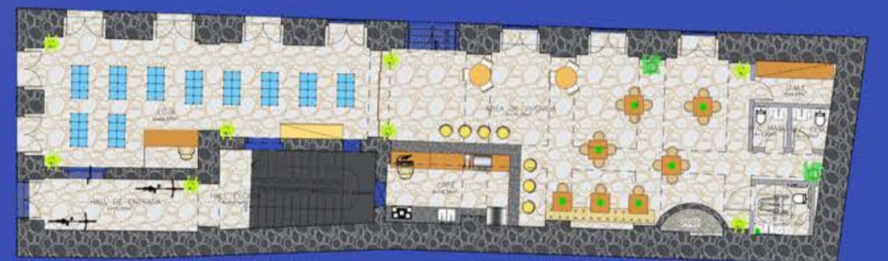
TÉRREO: Acesso de moradores | Loja | Café + Área de Vivência | D.M.L | Banheiros