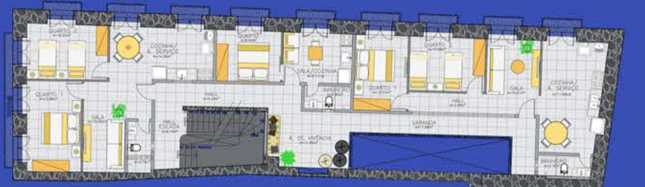
2º PAV.: Escada | Apartamento 3 e 4 | Loft | Área de Vivência