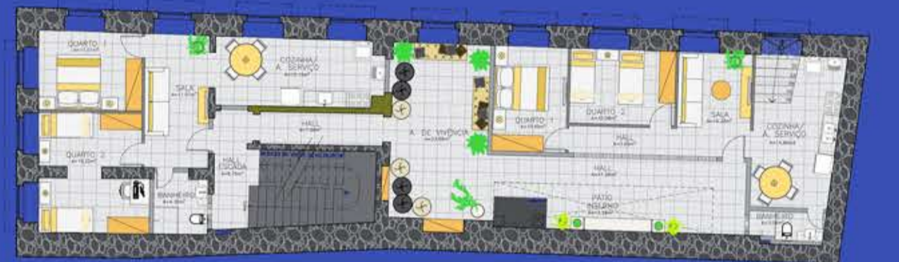
1º PAV.: Escada | Apartamento 1 e 2 | Área de Vivência