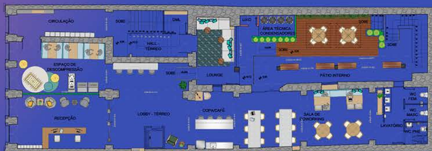
LAYOUT - TÉRREO