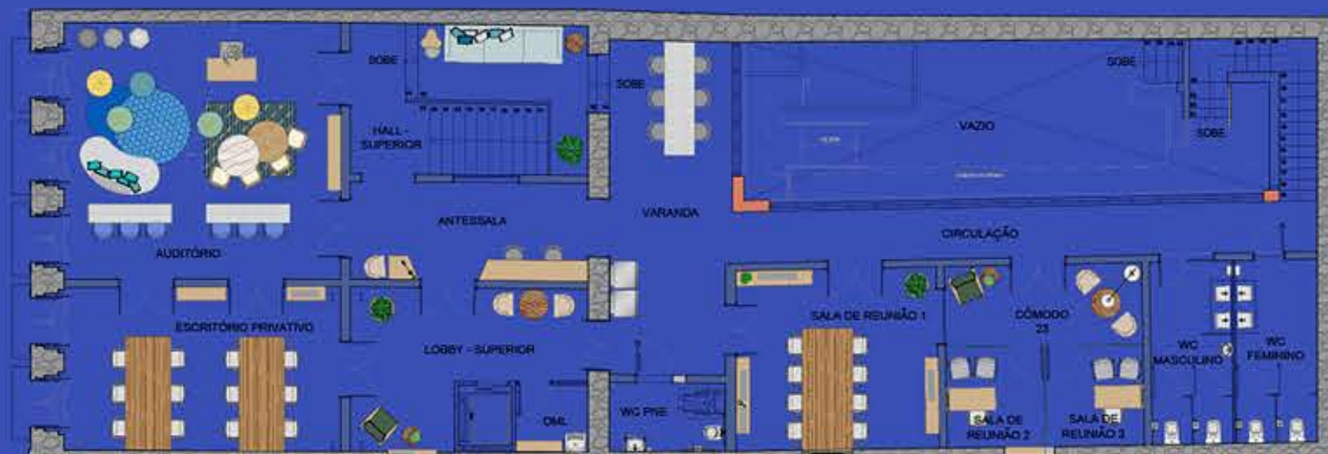
LAYOUT - PAVIMENTO SUPERIOR